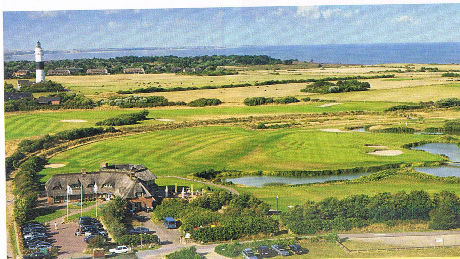
Unser Platz aus der Perspektive der Möwen.