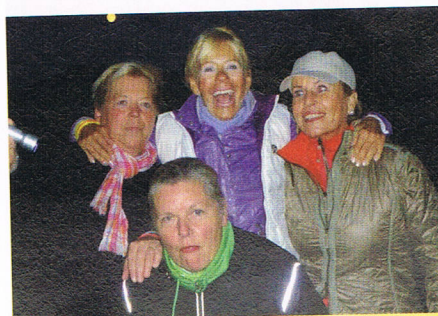
Mond und tolle Stimmung beim Night-Cup.

im Mittelpunkt. Nicht der ganze Tag ist verplant, sondern nur der Nachmittag. Das Abendessen kann trotzdem im Kreise der Familie eingenommen werden, der nicht turnierspielende Partner braucht nicht lange zu warten. Die Gäste können Golfplatz und Strand an einem Tag planen. Das alles scheinen für manche Spieler enorme Vorteile zu sein. Zunächst belächelt entwickelt sich das 9-Löcher-Turnier vielleicht zum wahren Hit – mindestens aber zu einer wahren (nicht minder sportlichen) Alternative zum reinen Gesellschaftsturnier. Oder ist es nur ein Zeichen der Zeit und schon bald wieder überholt, weil das gesellschaftliche Miteinander dabei doch zu kurz kommt? Wir sind gespannt und freuen uns derweil, so viele verschiedene Turnierformen anbieten zu können wie zum Beispiel den hervorragend und mit viel Liebe zum Detail von Rudolph Henle organisierten Evergreencup für Senioren.