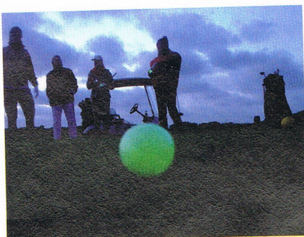
Impression vom Night-Golf-Cup.

In jedem Heft wird über die tollsten Rahmenbedingungen und Mottos für Turniere berichtet und dennoch wird der Andrang bei den üblichen Wochenturnieren geringer. Gleichwohl erfreuen sich die 9-Löcher-Abendturniere, die bei uns von 15 bis 18 Uhr vorzugsweise montags stattfinden, immer größerer Beliebtheit. Das liegt wohl kaum an mangelnder Kondition unserer Mitglieder, denn auch die Gäste nehmen in großer Zahl daran teil. Aber vielleicht steht hier die – kurze – sportliche Herausforderung