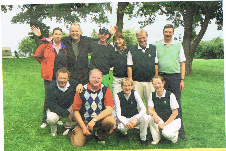
Die glückliche Seniorenmannschaft.

Die Senior(inn)en-Mannschaft errang im Förde-GC Glücksburg am 2. und 3. Juli einen hervorragenden zweiten Platz und hat sich damit den Klassenerhalt bei den DMM in der Landesliga Nord 1 erspielt. Nachdem am ersten Tag bei Regen und viel Wind in den klassischen Vierern ein eher durchschnittliches Ergebnis erzielt worden ist, liefen unsere Streiter in den Zählspiel-