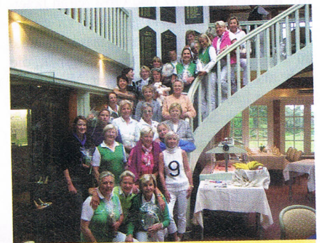
Strahlende Sieger des Lachmöwen-turniers.

Ersten (Jersbeck) ebenso wie die Jungsenioren in Gruppe A (12 Schläge hinter GC Kitzberg) an zweiter Stelle.